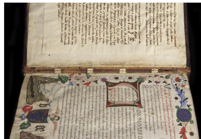
Milano, Archivio Storico Civico e Biblioteca Trivulziana, Cod. Triv. 696 (cuciture)